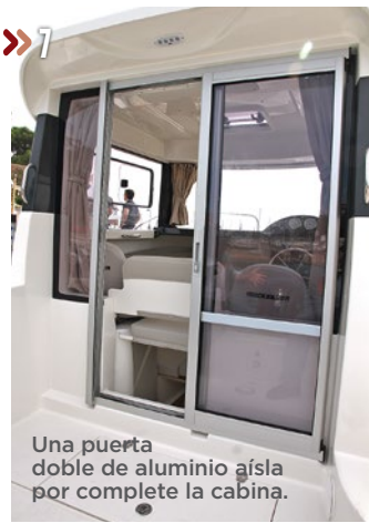
Una puerta doble de aluminio aísla por completo la cabina.