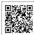
Vídeo Quicksilver Captur 555 Pilothouse (Náutica Guixols)

La Captur 555 Pilothouse destaca por su bañera bien adaptada a la pesca y con no pocos detalles, como el vivero, los cañeros y otros detalles. A este espacio principal de popa se añade una configuración asimétrica, con el paso lateral de estribor más ancho que el babor, lo que facilita el acceso hasta la proa. Delante, un banco para dos y el pozo de fondeo con roldana se complementan con el balcón abierto para facilitar el acceso desde el pantalán. Los herrajes de amarre están bien, tanto en proa como en popa. Entre otros, los pasamanos de inox a lo largo del techo de